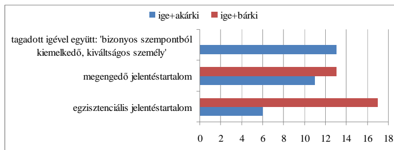
2. ábra. Az akárki és a bárki szemantikai megoszlása az MNSZ nyelvi adatai alapján

Ami a bár- és az akár- közötti szemantikai különbséget illeti, az említett korpuszelemzés (1. korábban) a már ismertetett eredmények mellett arra is rávilágított, hogy a vizsgálat tárgyává tett bárki és akárki névmások között figyelemre méltó jelentésbeli eltérés mutatkozik. Az elemzés végső eredményeit a 2. ábra mutatja be: